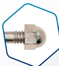
PORCA CALOTA: fabricada em Zamak com revestimento zincado branco