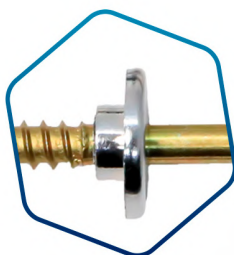
ARRUELA: fabricada em ABS com revestimento cromado