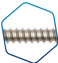
REVESTIMENTO: zincado branco