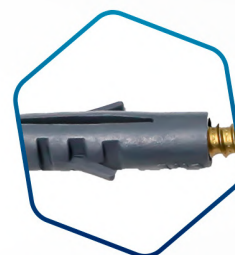
BUCHA em PEAD