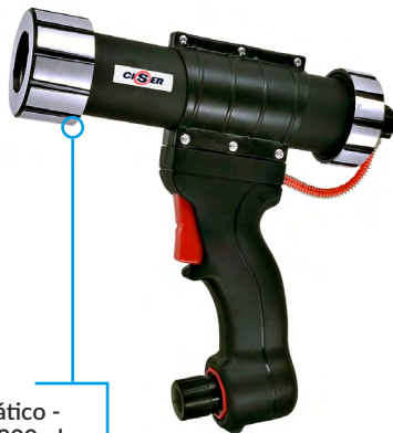
Aplicador Pneumático - Cartuchos de até 300ml