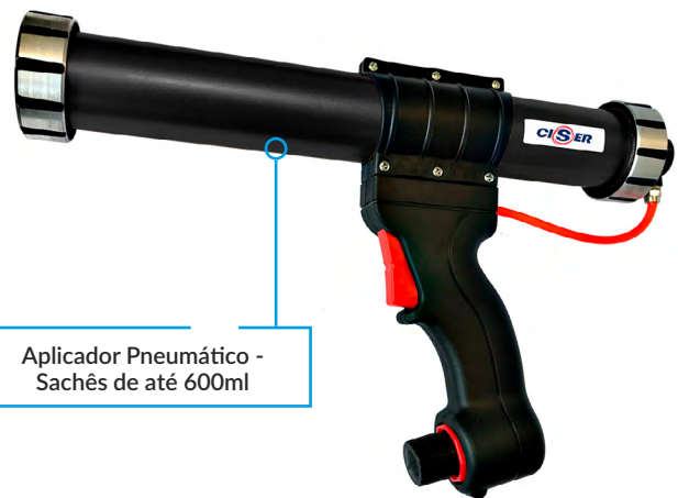
Aplicador Pneumático - Sachês de até 600ml