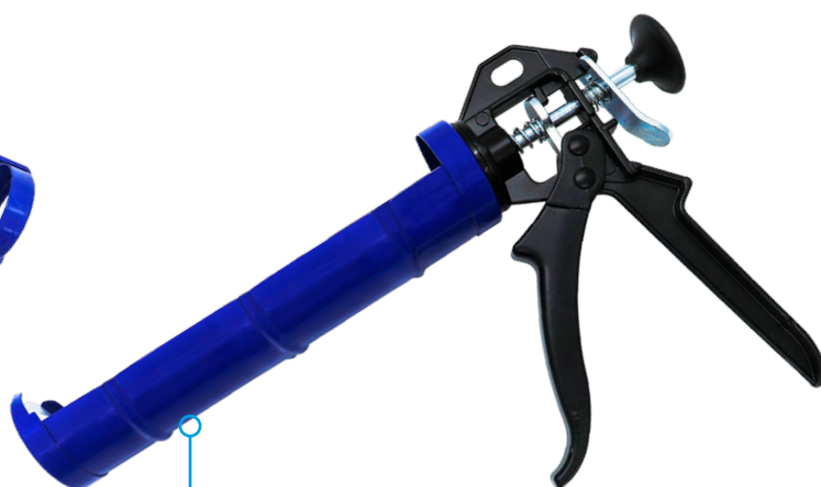
Aplicador Manual Profissional