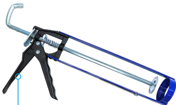
Aplicador Manual Standard